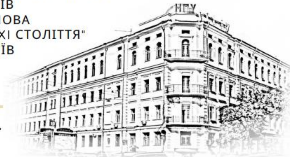
ЗОЛОТАРЕНКО Т.О. ГОЛОВА НТСА ФАКУЛЬТЕТУ ПЕДАГОГІКИ І ПСИХОЛОГІЇ