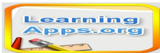
Рис. 2. Зображення онлайн-сервісу LearningApps.org

LearningApps.org – онлайн-сервіс, що дозволяє створювати інтерактивні вправи. Даний сервіс можна використовувати як за допомогою комп'ютера, так і за допомогою мобільних пристроїв. Конструктор LearningApps призначений для розробки, зберігання інтерактивних завдань з різних навчальних дисциплін, за допомогою яких учні можуть перевірити та закріпити власні знання в ігровій формі. Зображення онлайн-сервісу LearningApps.org подано на рис. 2.