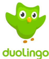
Рис. 1. Зображення мобільного додатку Duolingo

Duolingo: вивчай мови – мобільний додаток, що дозволяє вивчати іноземні мови, зокрема англійську. Він є простим у користуванні та не потребує обов'язкової авторизації. Зображення мобільного додатку Duolingo подано на рис. 1.