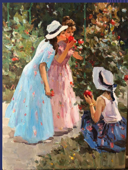
На прогулянці. 2020