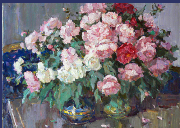
Рожеві піони. 2021