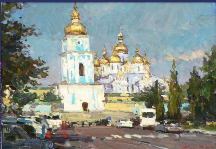
Михайлівський Золотоверхий собор. 2017