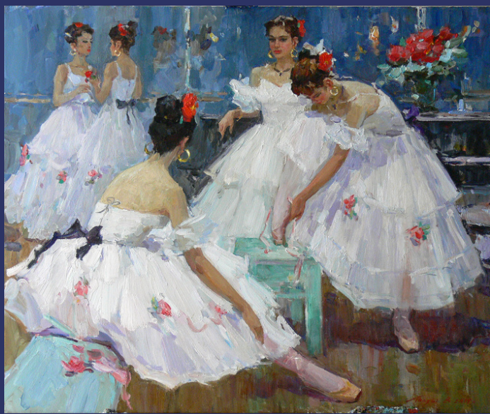
В балетному класі. 2017