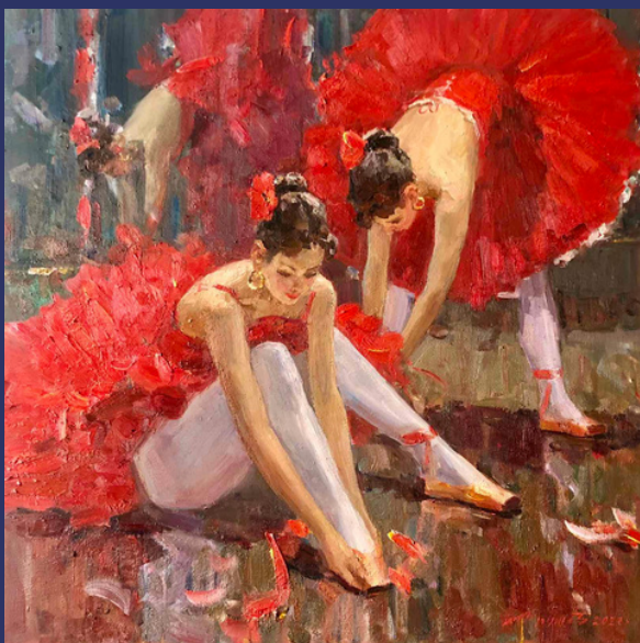
Балерина в червоному. 2021

Картини зберігаються в приватних колекціях США, Великобританії, Німеччини, Туреччини, Чехії та України